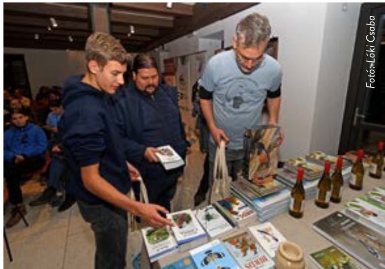
A madarászverseny első helyezettjei választják ki jutalmukat.