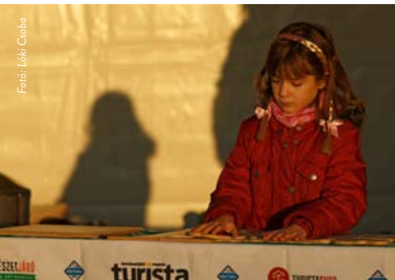
A jövő ténylegesen előremozdító döntéseik a kezükben!

Ugyanakkor a fesztiváli hangulatot továbbra is a madarak, a vadludak biztosítják, mi, emberek csak vendégek vagyunk!